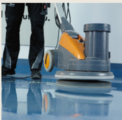
Очистите напольное покрытие, используя пады пола