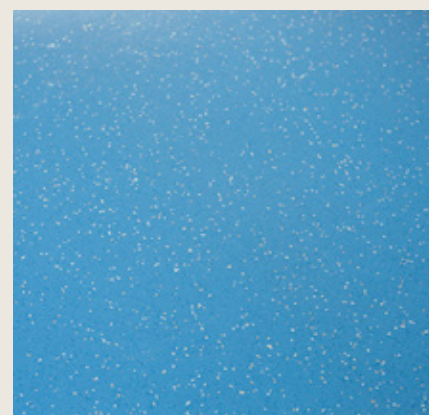
Результат – чистый пол