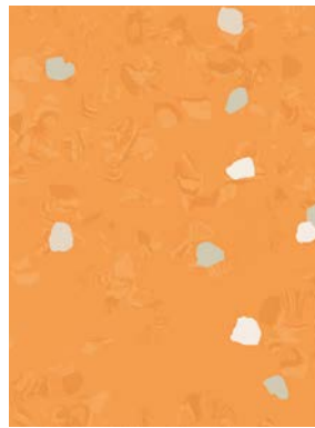
■ 🌊 7072