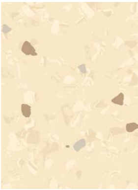
■ ⚡ 🌀 🕒 7055