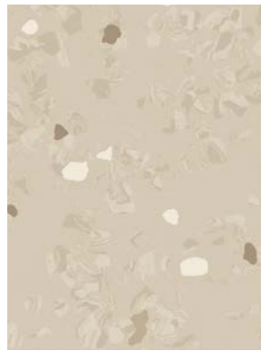
■ ⚡ 7052