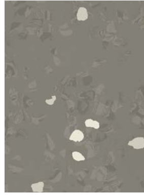
■ ⚡ 🌀 🌱 7033