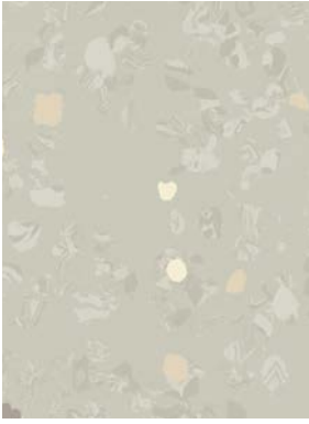
■ ⚡ 🌱 7031