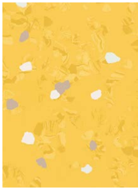
■ 🌊 7071