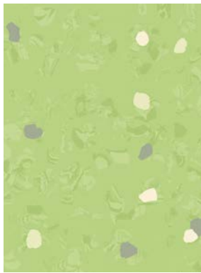
■ ⚡ 🌊 7067