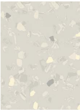
■ ⚡ 7035