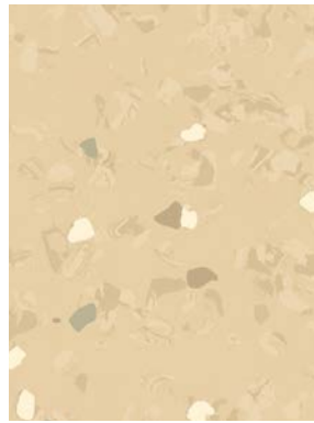
■ ⚡ 🌀 7056