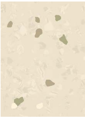
■ ⚡ 🕒 7051