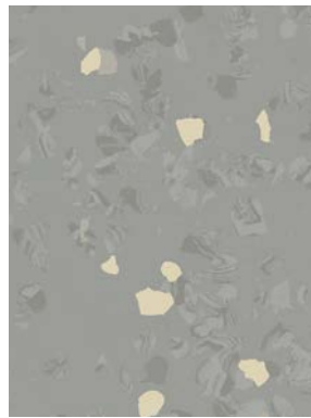
■ ⚡ 7036