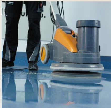
Puhdista lattia nora® laikalla