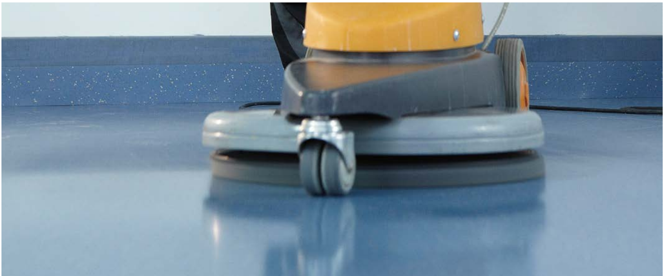
Veredelung. Beläge erst reinigen und dann auf Hochglanz polieren