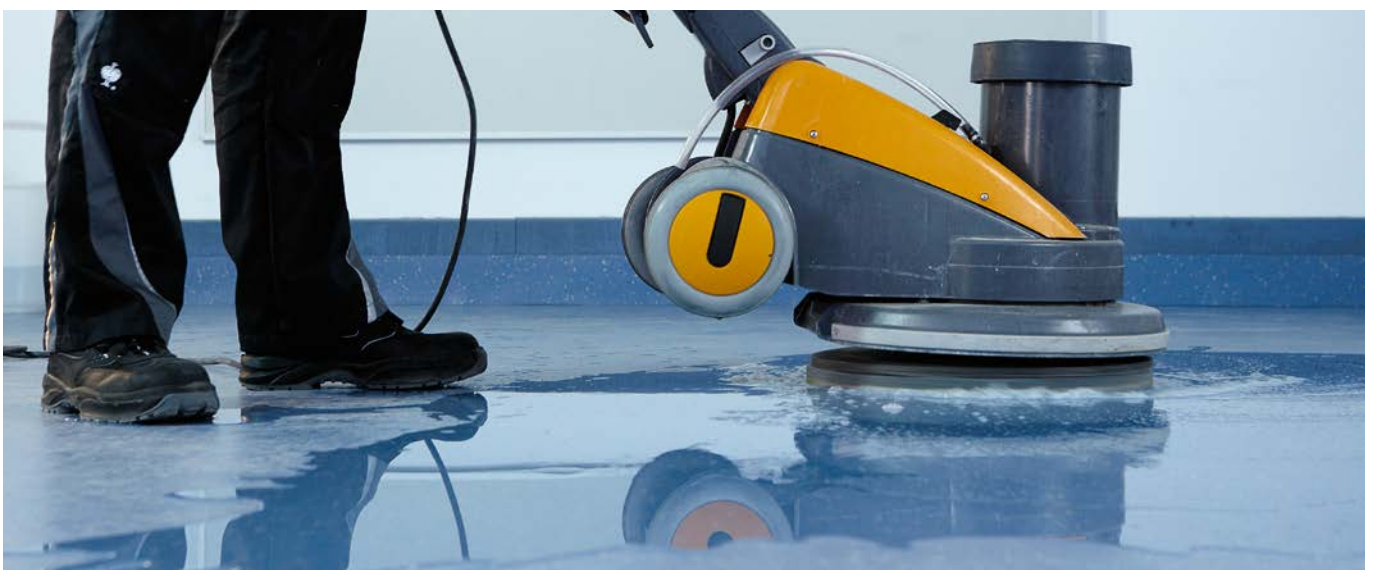
Sanierung. Beseitigung von hartnäckigstem Schmutz und Verkratzungen