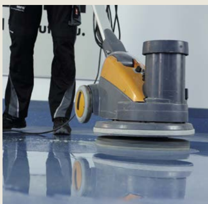
Belag mit nora® pads reinigen