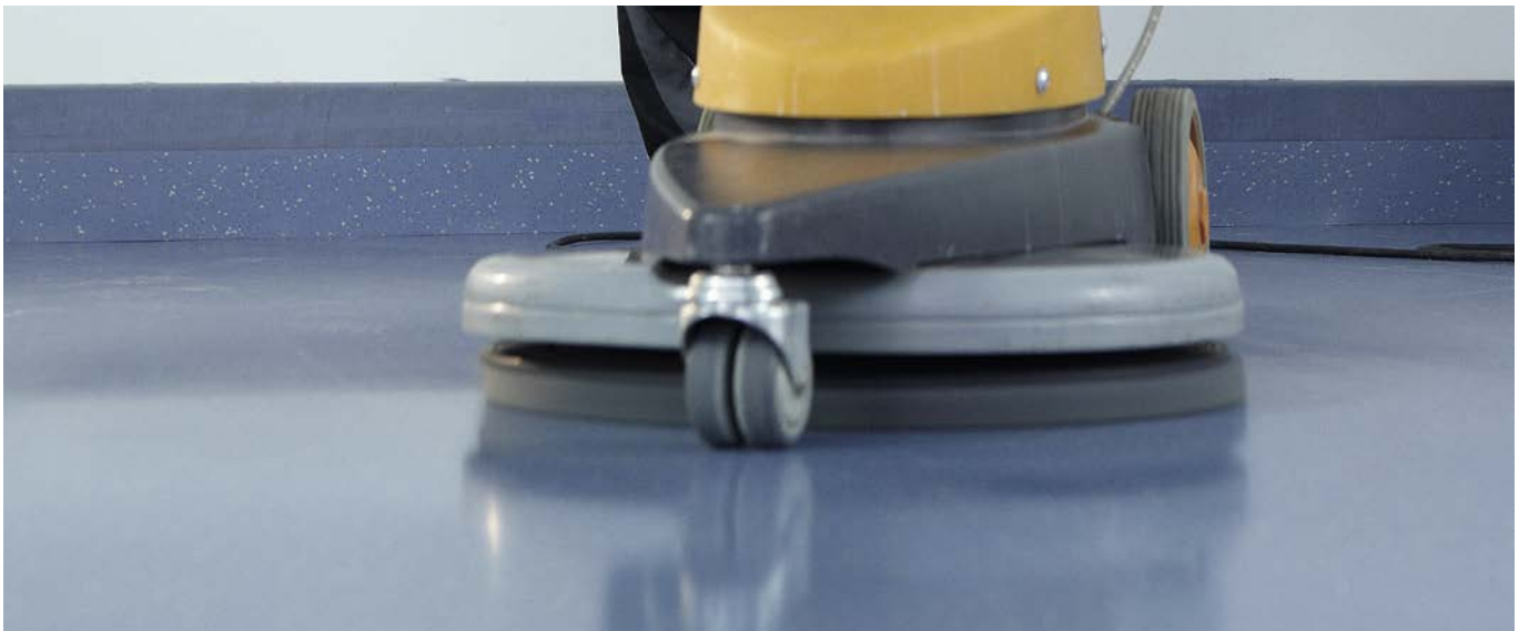
Veredelung. Beläge erst reinigen und dann auf Hochglanz polieren