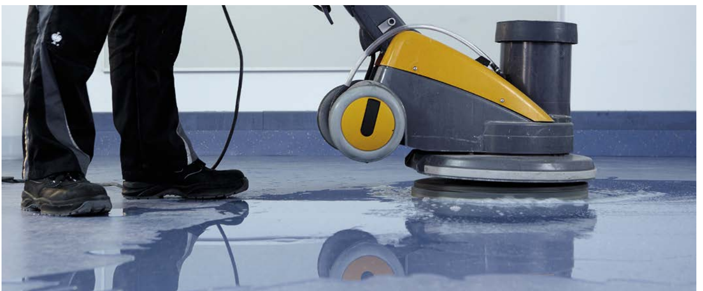
Sanierung. Beseitigung von hartnäckigstem Schmutz und Verkratzungen