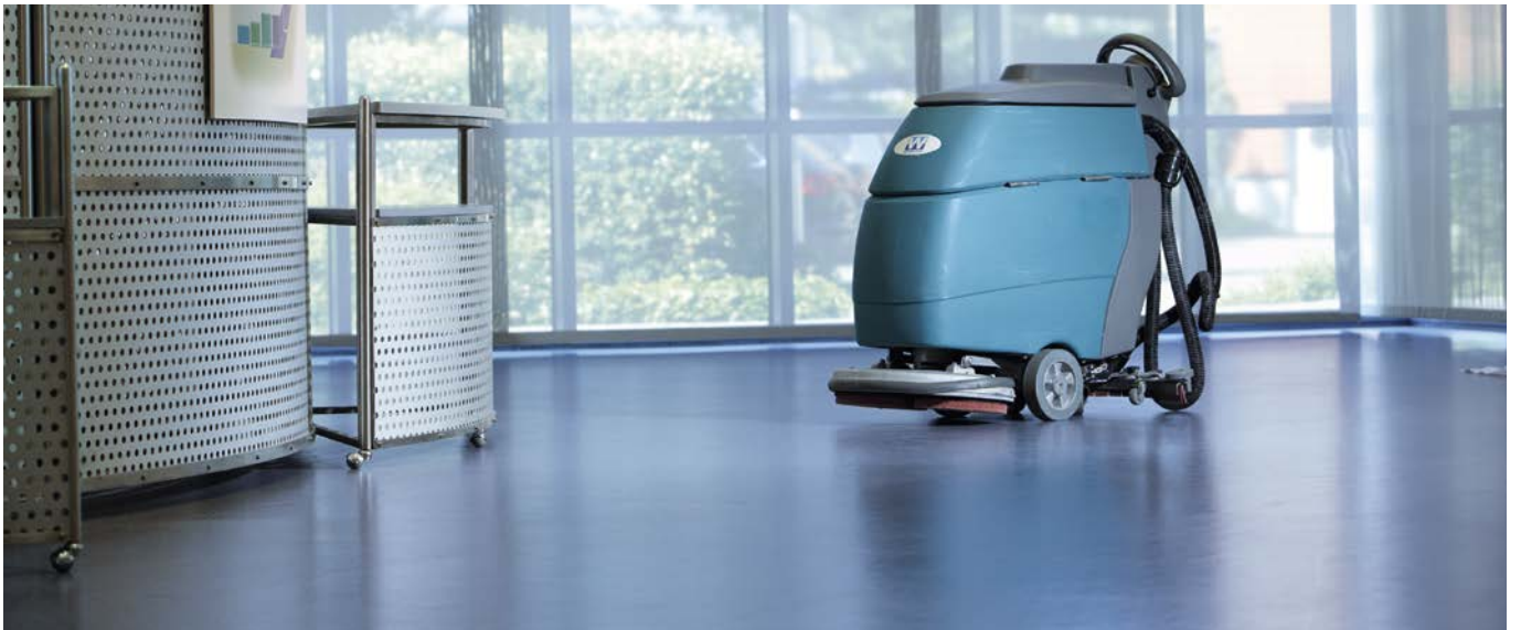
Reinigung. Von der täglichen Pflege bis zur Intensivreinigung