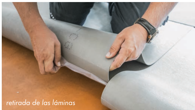
retirada de las láminas