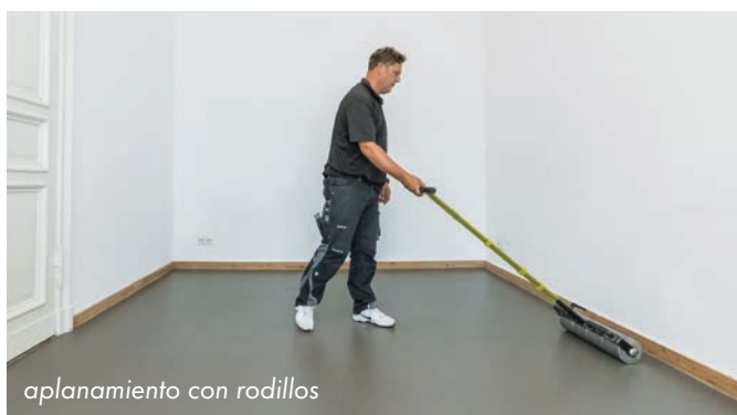
aplanamiento con rodillos