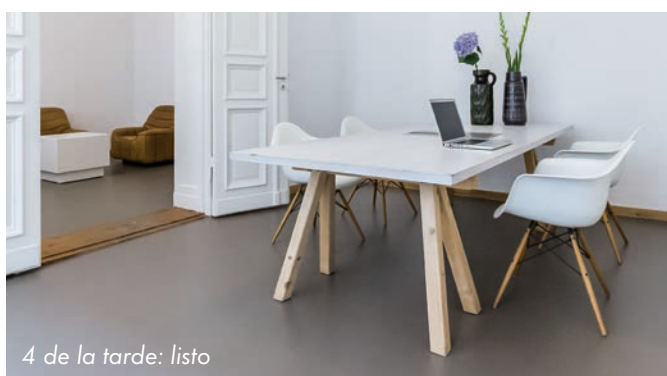
4 de la tarde: listo