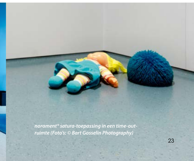
norament® satura-toepassing in een time-out-ruimte