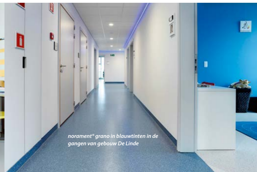
norament® grano in blauwtinten in de gangen van gebouw De Linde