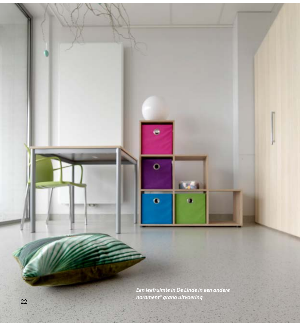
Een leefruimte in De Linde in een andere norament® grano uitvoering