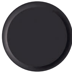
Superficie circular (grano)