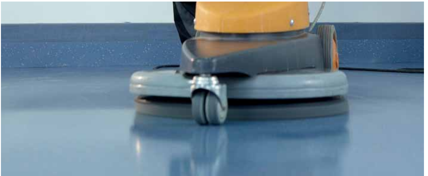
Veredelung. Beläge erst reinigen und auf Hochglanz polieren