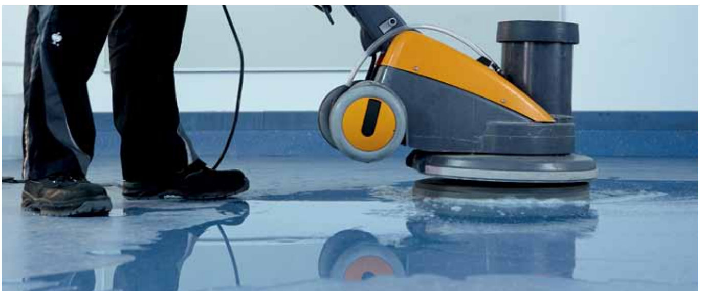
Instandsetzung. Beseitigung von hartnäckigstem Schmutz und Verkratzungen