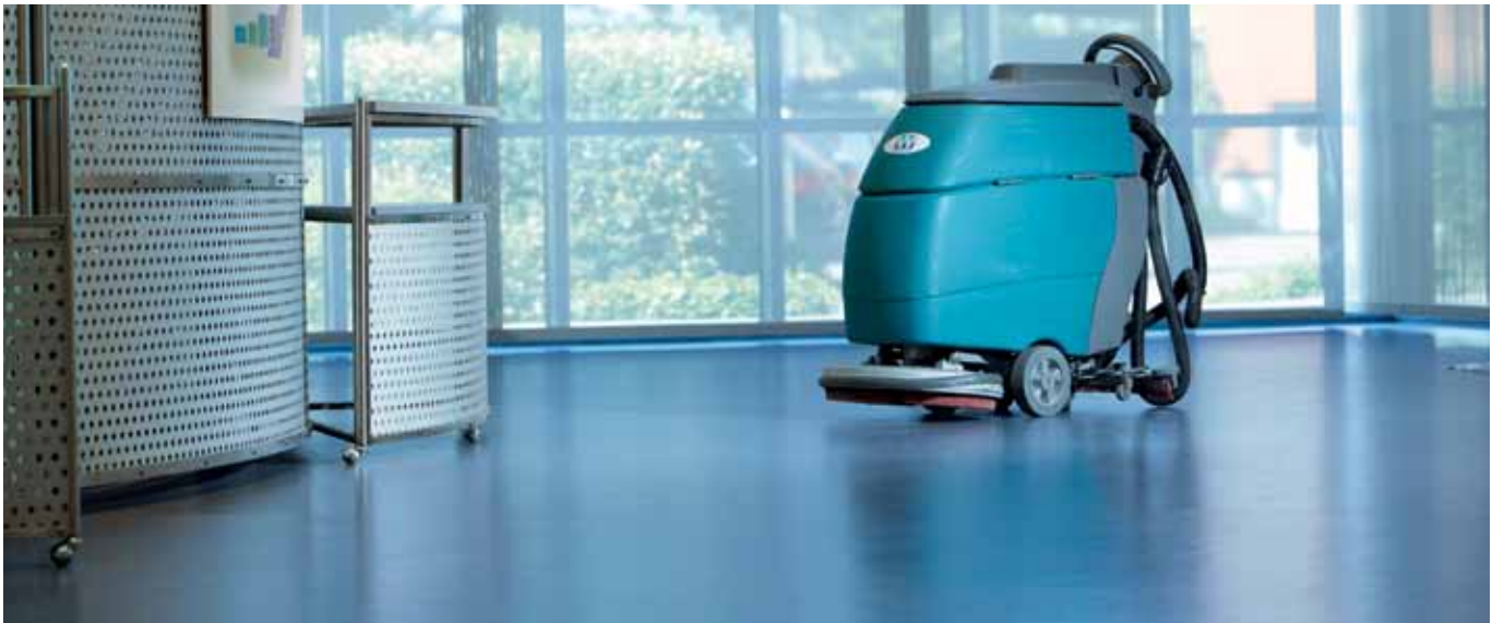
Reinigung. Von der täglichen Pflege bis zur Intensivreinigung