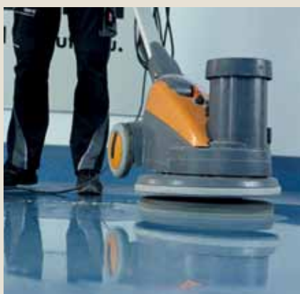
Belag mit nora® pads reinigen